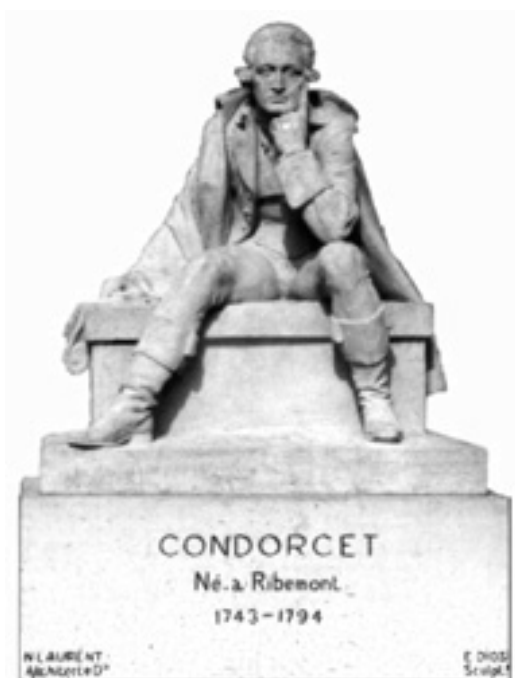
[afb. 2 Standbeeld te Ribemont]