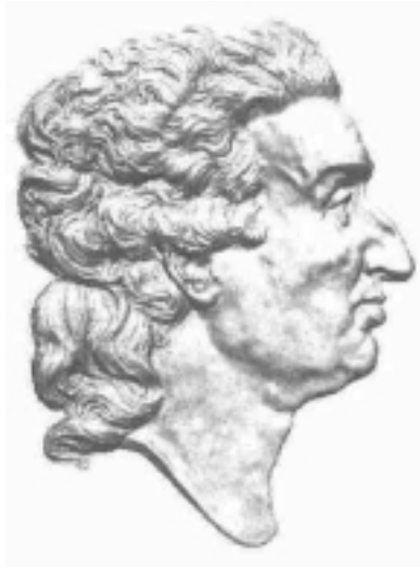
[afb. 3 Reliëf in het Lycée Condorcet te Parijs]