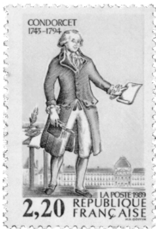
[afb. 10 Timbre Condorcet uit 1989]